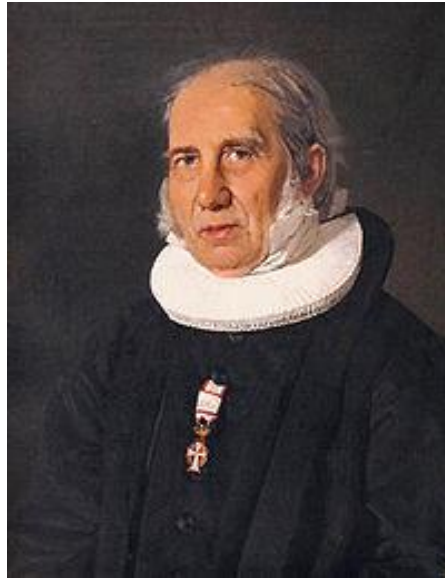
GRUNDTVIG PAA LANGELAND