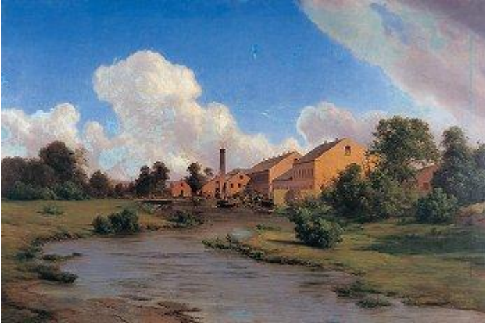
Silkeborg Papir fabrik 1850

Men snart vil over den stille Hede, Jernbanetoget, som en dampende Drage bruse afsted, og Tusinder skulle komme og see denne Egns Herligheder, og Digtere skulle her henlægge Sceneriet for deres Digtninger, medens Silkeborg stiger og blomstrer, som Oplandets By, Byen, der skal spinde Silke, naar Banetogets Væverskytte flyver gennem Landet.