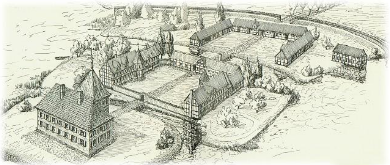
Rekonstruktion af Silkeborg Slot