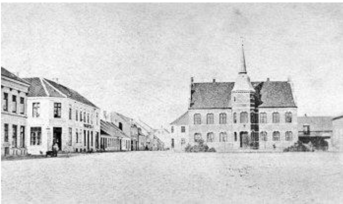
Silkeborg Raadhus opført 1857