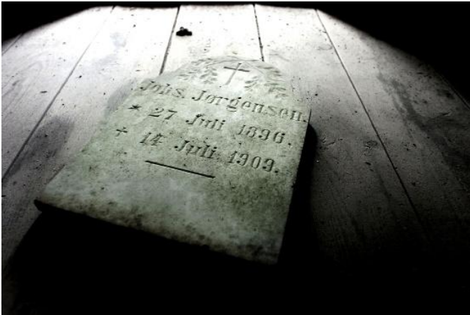
Gravsten i kirketårnet på Strynø, 30. maj 2005