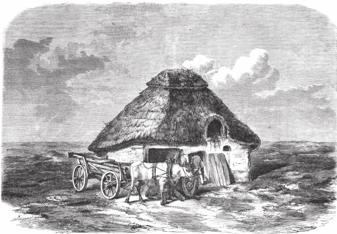
Skizze fra den jydke Hede.

Paa Alheden i Nørrejyland havde for længere Tid sien en Røverbande paa 12 Røvere sit Opholdssted *)